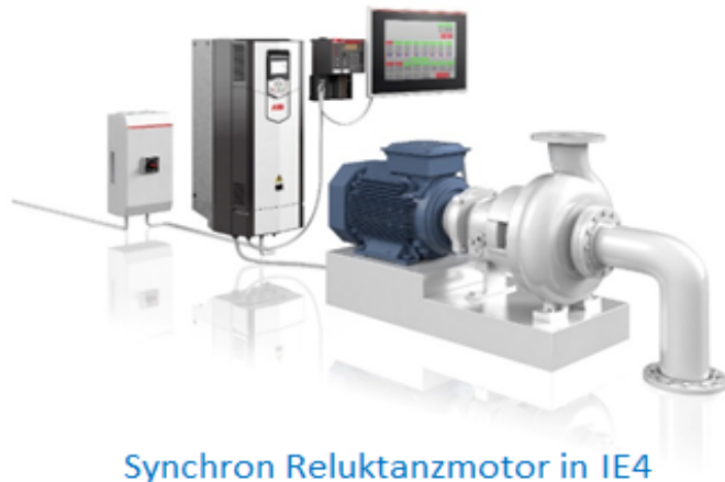
Synchron Reluktanzmotor in IE4